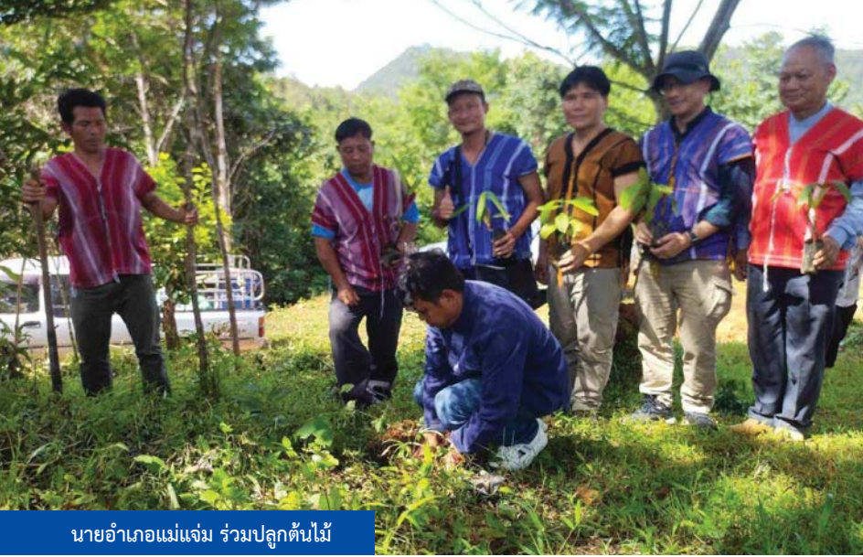
นายอำเภอแม่แจ่ม ร่วมปลูกต้นไม้