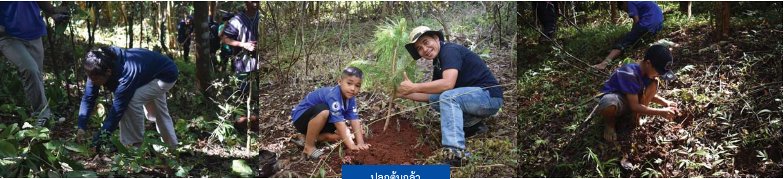
ปลูกต้นกล้า