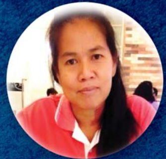
ปรีญานั้ส ฉิมมารกรม ผู้นำนั้สการ/นักร้องประสาน