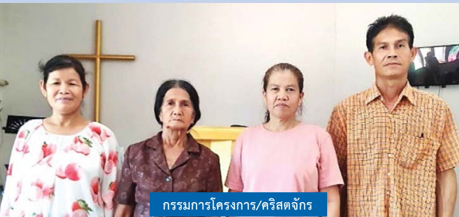
กรรมการโครงการ/คริสตจักร