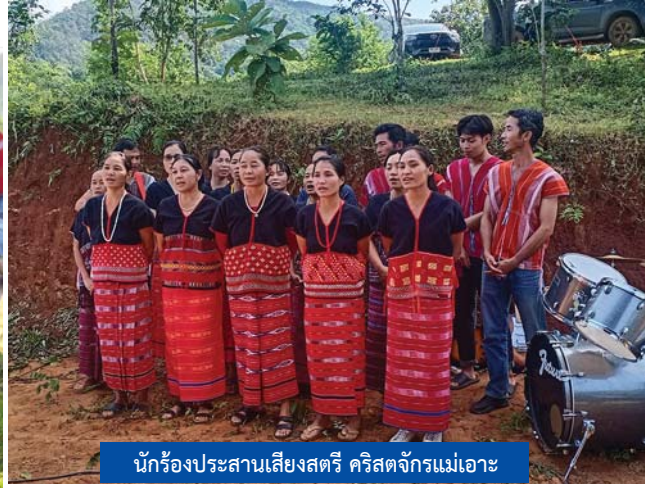
นักร้องประสานเสียงสตรี คริสตจักรแม่เอาะ