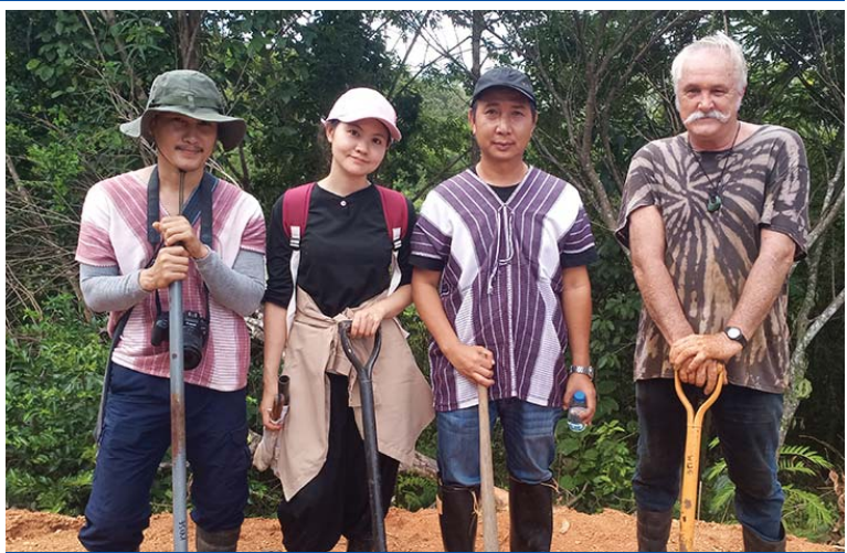
มูลนิธิภูมิปัญญาชาติพันธุ์