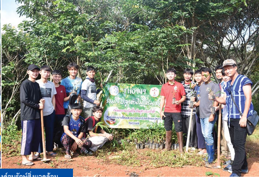
ป้ายรณรงค์อนุรักษ์สิ่งแวดล้อม