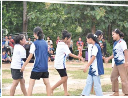
กีฬาสัมพันธ์