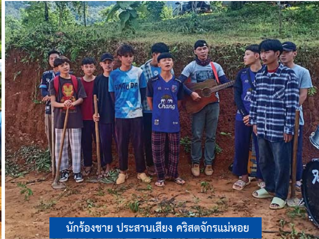
นักร้องชาย ประสานเสียง คริสตจักรแม่หอย