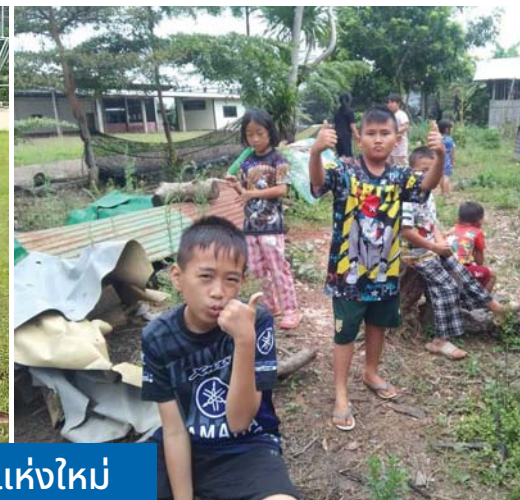
พันธกิจพัฒนาเด็กแบบองค์รวม ที่สถานประกาศแห่งใหม่