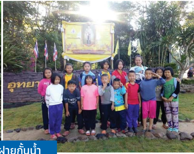
กิจกรรมอนุรักษ์สิ่งแวดล้อม กำฝายกั้นน้ำ