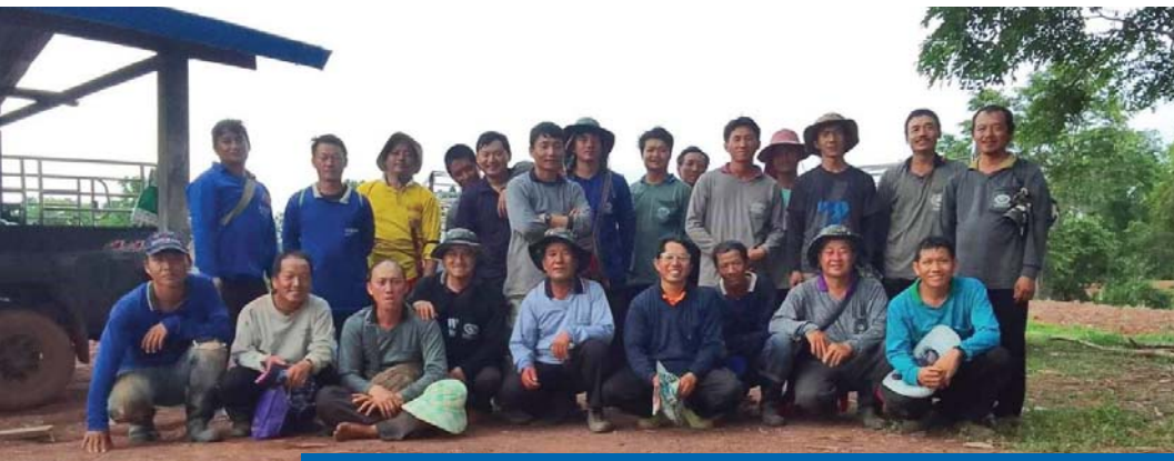
สมาชิกปลูกข้าวโพดเพื่อหารายได้เข้าคริสตจักร

สำหรับความยั่งยืนในด้านการยังชีพ คริสตจักรได้ทำการจัดสรรแบ่งพื้นที่ในที่ดินที่คณะกรรมการของคริสตจักรซื้อไว้ให้เป็นสัดส่วน แต่เดิมพื้นที่ประมาณ 40 ไร่ ซื้อมาในราคาประมาณ 600,000 บาท เพื่อใช้เป็นสุสานของคริสตจักร เมื่อปรับพื้นที่ใหม่จึงแบ่งส่วนหนึ่งไว้ทำเกษตรเพื่อสร้างรายได้ให้กับคริสตจักร ด้วยการลงแรงของพี่น้องสมาชิกคริสตจักรที่ช่วยกันเพาะปลูกมาเป็นเวลาหลายปี ทั้งมันสำปะหลังและข้าวโพด ได้สร้างรายได้ให้คริสตจักรสามารถนำเงินส่วนนี้มาสนับสนุนการทำพันธกิจต่าง ๆ ต่อไป รวมถึงพันธกิจพัฒนาเด็กและเยาวชนแบบองค์รวมนี้ด้วย เรียกได้ว่า พันธกิจนี้สามารถไปต่อได้ด้วยน้ำพักน้ำแรงของคนในคริสตจักรอย่างแท้จริง